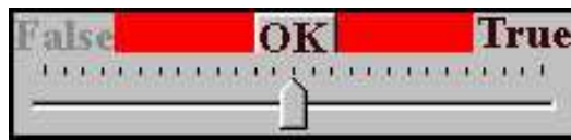
Рис. 2. Елемент управління

бігунка перераховується із залученням апарату нечіткої логіки і відповідь оцінюється так, що з неї виключається складова, пов'язана з неточною інтерпретацією ступеня впевненості студента.