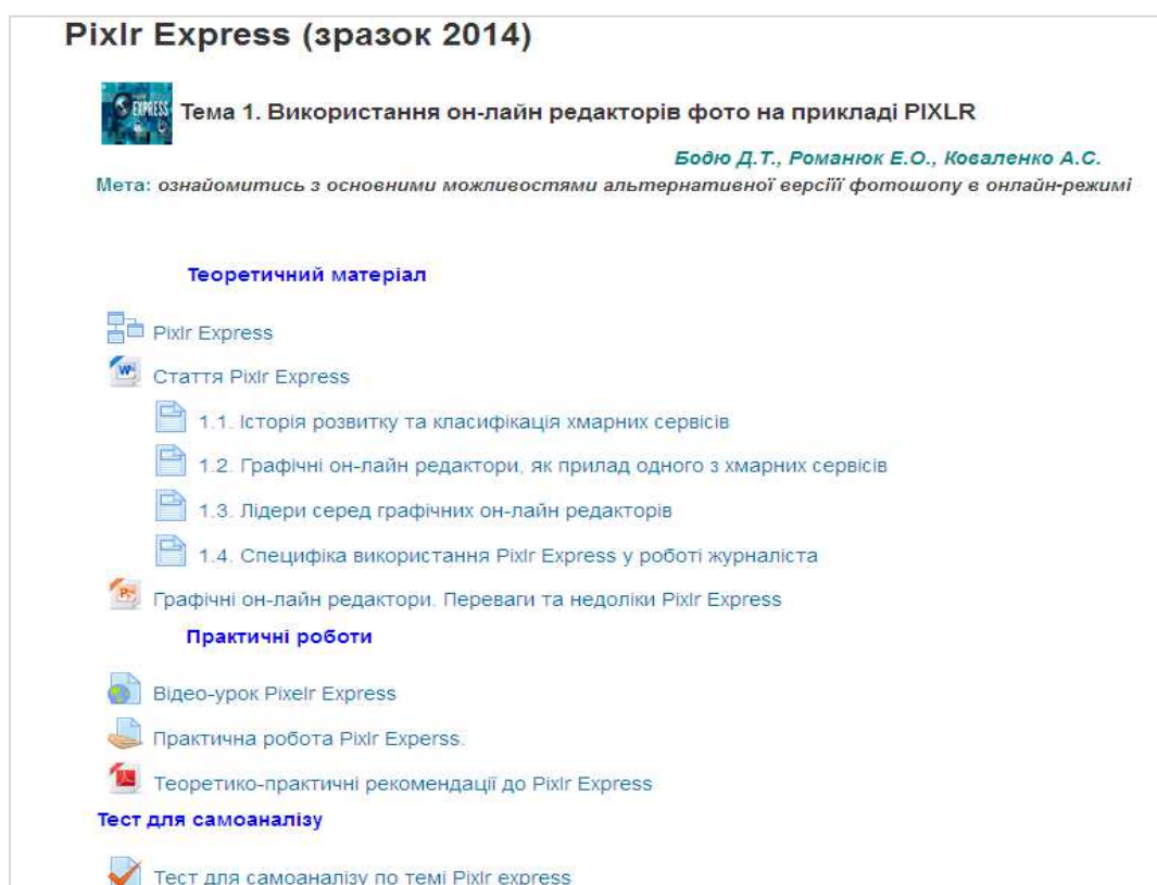
Рис. 1. Приклад теми Pixlr Express як електронного методичного матеріалу

Наведемо приклад реалізації даної таблиці в системі дистанційного навчання Moodle (рис. 1).