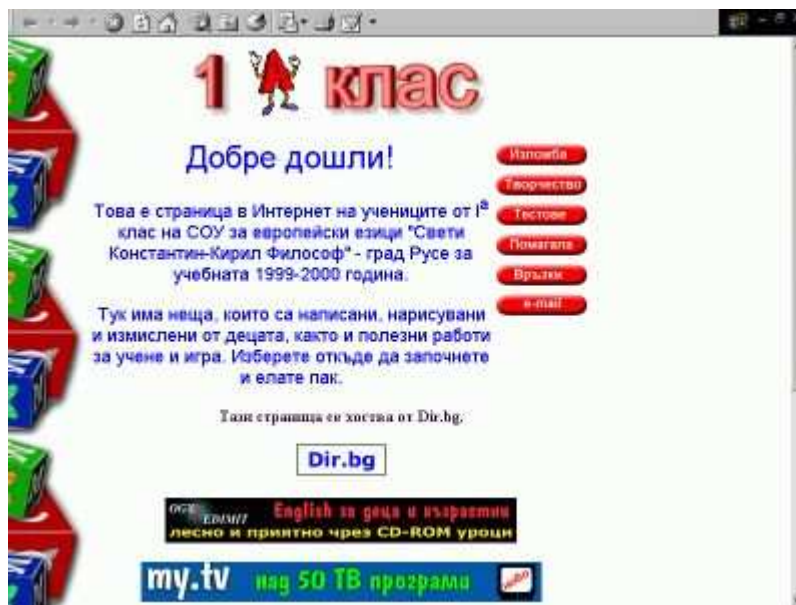
Рис. 2. Інтерфейс сайту http://a-class.hit.bg для 1-го класу

http://a-class.hit.bg ) , що має підвищити мотивацію вивчення цих предметів та надати можливість швидко засвоїти комп'ютерні технології.