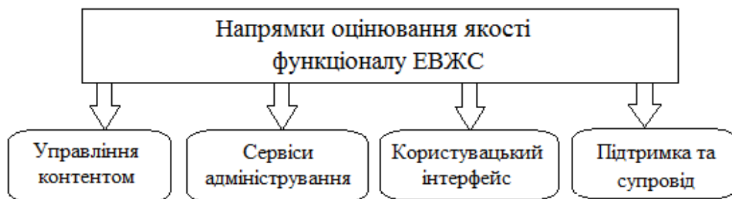
Рис. 1. Напрямки оцінювання якості ЕВЖС за [19], [21]

Як результат систематизації та узагальнення попереднього досвіду, дослідниками Кабат Ф., Абуелраб Е., Хасан Л. (Kharbat F., Abuelrub E., Hasan L.) [3], [19], [21] розроблена розширена оцінювальна рамка , що містить набір основних критеріїв та показників якості електронних відкритих журнальних систем (табл. 4). Запропоновані в ній критерії логічно поділяються на чотири групи: 1) управління контентом, 2) сервіси адміністрування, 3) користувацький інтерфейс, 4) підтримка та супровід (рис. 1).