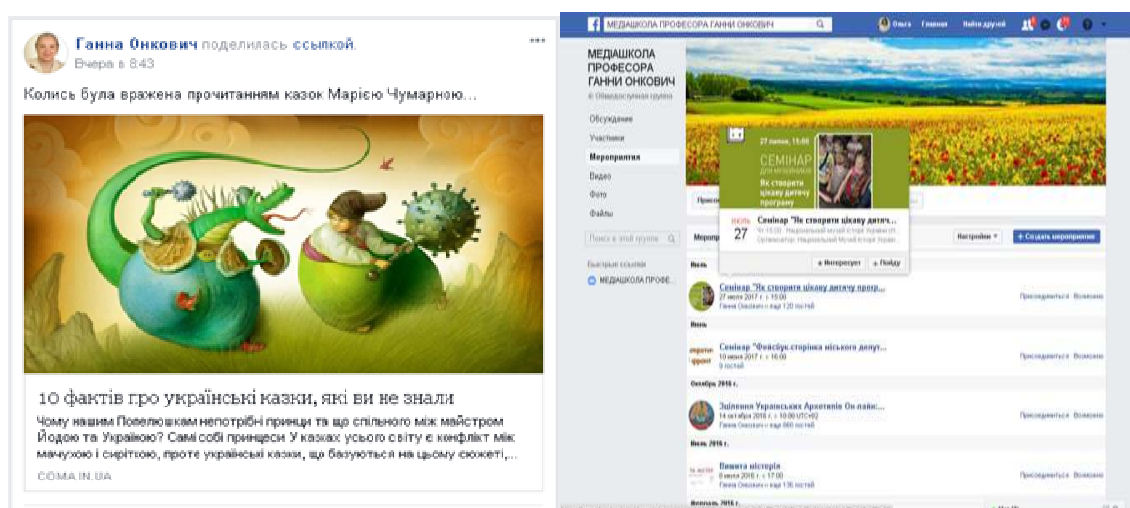
Рис. 2. Сторінки групи «Медіашкола професора Ганни Онкович» у соцімережі Facebook

У процесі Інтернет або мережної міжособистісної комунікації засобами ЕСМ між суб'єктами освітнього процесу відбувається обмін інформацією, виконуються різні дії з метою планування спільної діяльності. Це забезпечує взаємне стимулювання, контроль та взаємодопомогу в процесі розв'язання спільних проектів, а також сприяє більш ефективному їх виконанню.