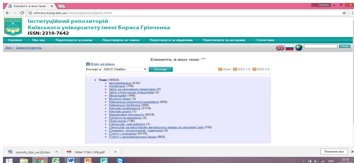
Рис. 2. Скріншот сторінки сайту Інституційного репозиторію Київського університету імені Бориса Грінченка