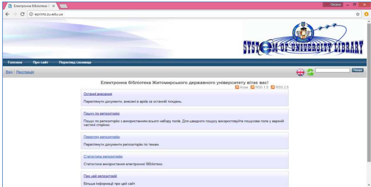
Рис. 1. Скріншот головної сторінки сайту електронної бібліотеки ЖДУ імені Івана Франка

Електронну бібліотеку ЖДУ імені Івана Франка (зображення головної сторінки сайту цієї ЕБ подано на рис. 1) розроблено й впроваджено Житомирським державним університетом імені Івана Франка на засадах Європейських освітньо-наукових бібліотечних систем. Під час опитування студенти зазначали, що ця ЕБ здійснює оперативне забезпечення інформаційних запитів її користувачів, пропонує актуальні електронні бази даних для підтримання наукової і навчальної роботи в університеті.