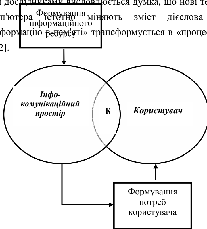
Рис. 1. Вплив глобального інформаційного середовища на формування особистісних потреб користувача ( КС – когнітивне середовище)

У випадку сформованого власного інформаційного середовища новизна знань визначається їх новизною для користувача. Новизна може визначатися також різноманітністю структур, у яких користувач поєднує інформаційні складові, що подаються за його запитом. З точки зору сучасної термінології, таке маніпулювання знанням має назву "інженерія знань": користувач інфокомунікаційного простору конструює нове знання добором особистісно важливої інформації, тобто інформації, яка, за розумінням користувача, є важливою для отримання нового знання [1]. Сьогодні деякими дослідниками висловлюється думка, що нові технології навчання за допомогою комп'ютера істотно міняють зміст дієслова «знати». Поняття «накопичувати інформацію ресурсу» трансформується в «процес одержання доступу до інформації» [12].