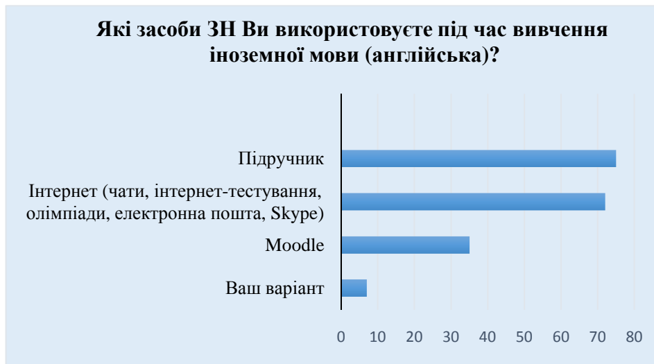
Рис. 1. Засоби, які використовуються під час змішаного навчання іноземної мови

Відповідаючи на запитання про засоби, які студенти використовують під час змішаного навчання іноземної мови, 75% (53) відповідачів засвідчили активне використання підручника, а 72% (51) – Інтернету. Однак платформа дистанційного навчання Moodle виявилась менш затребуваною серед опитаних – 35% (25). 7% (5) студентів запропонували використання бібліотечного фонду університету та конспектів занять у якості свого варіанту (рис. 1).