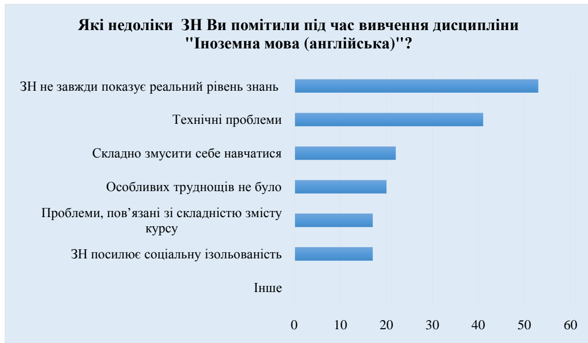
Рис. 5. Недоліки змішаного навчання

У сьомому запитанні ми запропонували студентам перелік потенційних недоліків під час змішаного навчання англійської мови. Більшість респондентів, а саме 53% (38) вважають, що ЗН не завжди показує реальний рівень знань. 41% (29) опитаних наголосили на окремих технічних проблемах під час організації ЗН. Думку про погану мотивацію до навчання (лінь) підтримали 22% (16) студентів. 20% (14) респондентів не виявили особливих труднощів під час ЗН, проте 17% (12) наголосили на складності змісту курсу та соціальній ізолюваності, яку, на їх думку, посилює ЗН (рис.5).