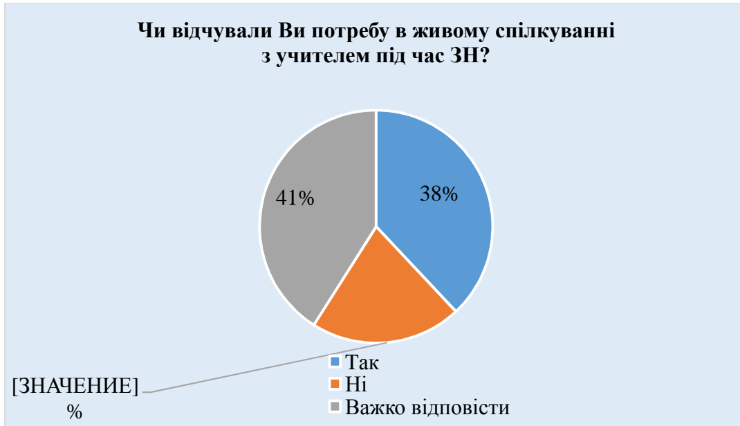
Рис. 6. Визначення потреби студентів у живому спілкуванні

Відповідаючи на восьме запитання: «Чи відчували Ви потребу в живому спілкуванні з учителем під час ЗН?», 38% (27) студентів зазначили, що відчують потребу у живому спілкуванні, 21% (15) респондентам електронне навчання повністю заміняє живе спілкування, а для 41% (29) опитуваних було важко дати відповідь (рис.6).