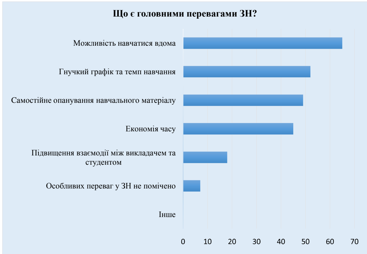
Рис. 3. Переваги змішаного навчання

Серед переваг ЗН англійської мови 65% (46) студентів називають можливість навчатися вдома, 52% (37) респондентів відзначають гнучкий графік та темп навчання, 49% (35) опитаних наголошують на можливості здобути досвід самостійного опанування навчального матеріалу, 45% (32) людей зазначили економію часу під час ЗН іноземної мови, 18% (13) осіб погодились, що ЗН підвищує взаємодію між викладачем та студентом і лише 7% (5) студентів не помітили особливих переваг у змішаному навчанні (рис.3).