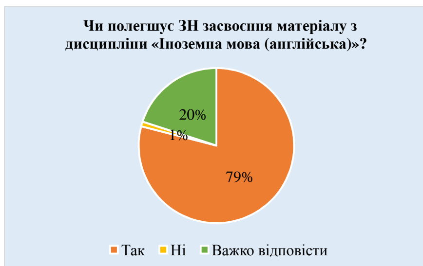
Рис. 2. Оцінювання ступеня засвоєння матеріалу за допомогою методики ЗН з дисципліни «Іноземна мова (англійська)»

На третє запитання: «Чи полегшує змішане навчання засвоєння матеріалу з дисципліни «Іноземна мова (англійська)»?», 79% (56) студентів відповіли «так», 20% (14) було важко відповісти і лише 1% (1) відповів «ні» (рис.2).