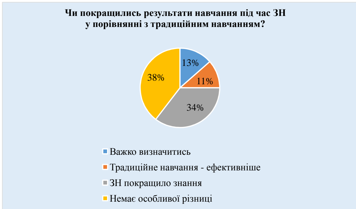
Рис. 4. Порівняння результатів навчання за допомогою змішаного навчання та традиційного навчання

У сьомому запитанні ми запропонували студентам перелік потенційних недоліків під час змішаного навчання англійської мови. Більшість респондентів, а саме 53% (38) вважають, що ЗН не завжди показує реальний рівень знань. 41% (29) опитаних наголосили на окремих технічних проблемах під час організації ЗН. Думку про погану мотивацію до навчання (лінь) підтримали 22% (16) студентів. 20% (14) респондентів не виявили особливих труднощів під час ЗН, проте 17% (12) наголосили на складності змісту курсу та соціальній ізолюваності, яку, на їх думку, посилює ЗН (рис.5).