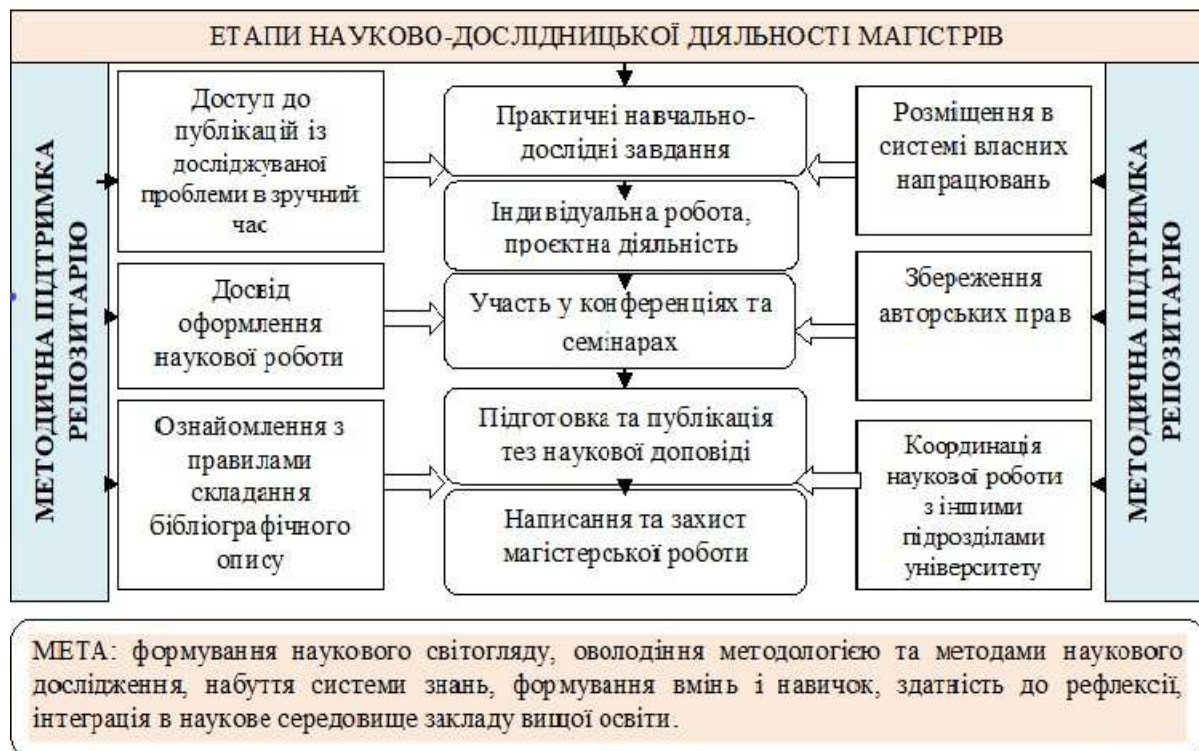
Рис. 1. Модель методичної підтримки інституційним репозитарієм процесу формування науково-дослідницьких навичок магістрів

Інформаційна база інституційного репозитарію здатна надавати методичну підтримку магістрам на ключових етапах їхньої науково-дослідницької діяльності, передбаченої програмами навчальних дисциплін (див. рис. 1).