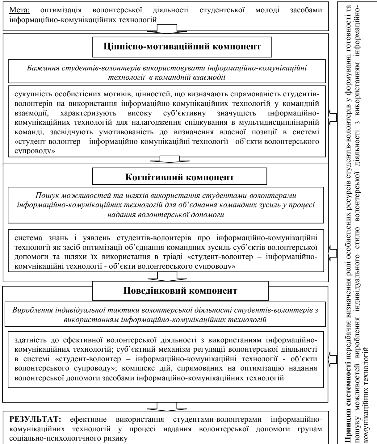
Рис. 2. Модель формування готовності студентів-волонтерів до використання ІКТ у процесі надання волонтерської допомоги

студентів засобами інформаційно-комунікаційних технологій (рис. 2). Розроблена модель ґрунтується на загальнонаукових принципах детермінізму, розвитку, відображення, єдності свідомості та діяльності, системності та гуманізму. З-поміж згаданих провідним є принцип системності, який передбачає визначення ролі особистісних ресурсів студентів-волонтерів у формуванні готовності та пошуку можливостей вироблення індивідуального стилю волонтерської діяльності з використанням інформаційно-комунікаційних технологій.