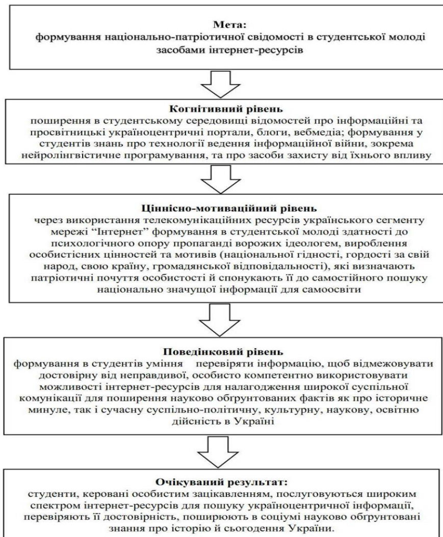
Рис. 2. Послідовність формування у студентів патріотичного світогляду засобами інтернет-ресурсів

3) діяльнісний рівень є найвищим; на нашу думку, досягнення його неможливе без розвинених когнітивного та емотивного рівнів. Він виявляється в громадянській активності, у свідомій суспільно-політичній поведінці індивіда, у патріотичних вчинках, як-от: сумлінна праця у своїй країні, захист її території, економічних інтересів, суверенітету.