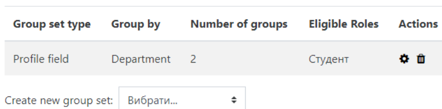
Рис. 8. Правило автоматичного створення груп на курсі

Однак, незважаючи на налаштування за замовчуванням, перед використанням плагіна треба активувати в кожному курсі, вибравши Користувачі - Групи - Auto Groups , та задати там такі параметри: Create new group set = Profile field , Group by = department , Eligible Roles = Студент . У результаті в меню Учасники – Групи – Auto Group буде створено приблизно такий рядок (Рис. 8):