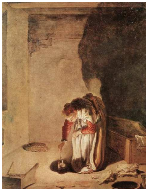
Доменіко Фетті (1588-1623)

Для розвитку цього аспекту варто запропонувати репродукції картин з неявно релігійним сюжетом (наприклад, «Притча про загублену драхму» Д. Фетті, рис. 3),